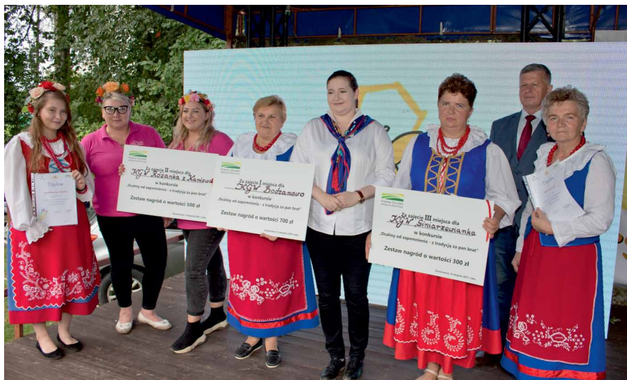
Kujawianki nagrodzone w konkursie na najbardziej tradycyjne stoisko podczas Miodowego Lata w Zarzeczewie 8 sierpnia 2021 roku

Nowe pole do działania dla kół dała Ustawa z dnia 9 listopada 2018 r. o kołach gospodyń wiejskich, która weszła w życie 29 listopada 2018 roku. Została ona znowelizowana – 22 lipca 2021 roku weszła w życie ustawa z dnia 24 czerwca 2021 r. o zmianie ustawy o kołach gospodyń wiejskich. Tym samym zostały określone formy i zasady dobrowolnego zrzeszania się w koła gospodyń wiejskich oraz tryb zakładania i organizacja wewnętrzna KGW. „W myśl ustawy KGW jest dobrowolną, niezależną od administracji rządowej i jednostek samorządu terytorialnego, samorządną społeczną organizacją mieszkańców wsi, wspierającą rozwój przedsiębiorczości na wsi i aktywnie działającą na rzecz środowisk wiejskich” – zaznacza ustawodawca. Nowo powstające koło gospodyń wiejskich podlega obowiązkowi wpisu do Krajowego Rejestru Kół Gospodyń Wiejskich prowadzonego przez Agencję Restrukturyzacji i Modernizacji Rolnictwa (ARiMR). Z chwilą dokonania wpisu do rejestru koło gospodyń wiejskich nabywa osobowość prawną (chyba, że jest to koło, które już posiada taką osobowość), zostaje w pełni samorządną organizacją mieszkańców wsi, niezależną m.in. od kółek rolniczych oraz od administracji rządowej i jednostek samorządu terytorialnego. Ma wówczas możliwość legalnego handlu i uzyskania przychodów z prowadzonej, zgodnie z Ustawą, sprzedaży wyrobów sztuki ludowej, w tym rękodzieła i rzemiosła ludowego i artystycznego, żywności regionalnej. Przychodem dla koła mogą być też nagrody pieniężne np. za udział w różnego rodzaju