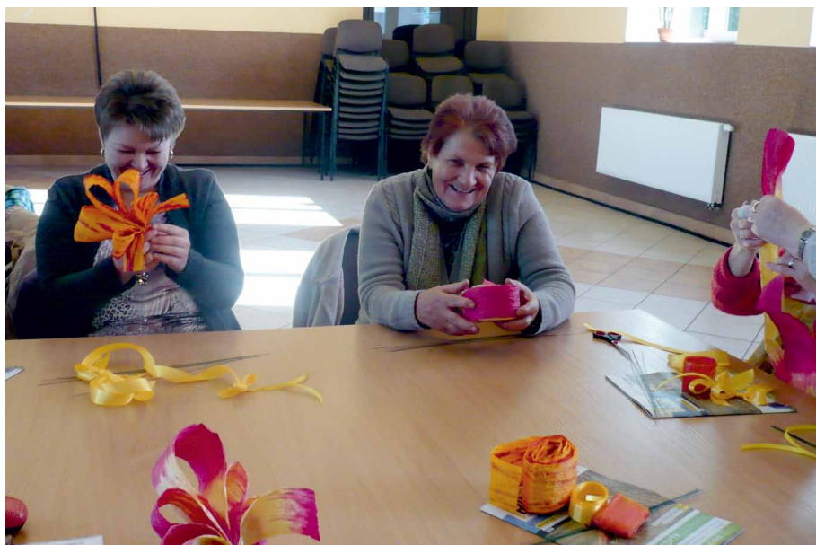
Warsztaty rękodzielnicze – Bądkowo