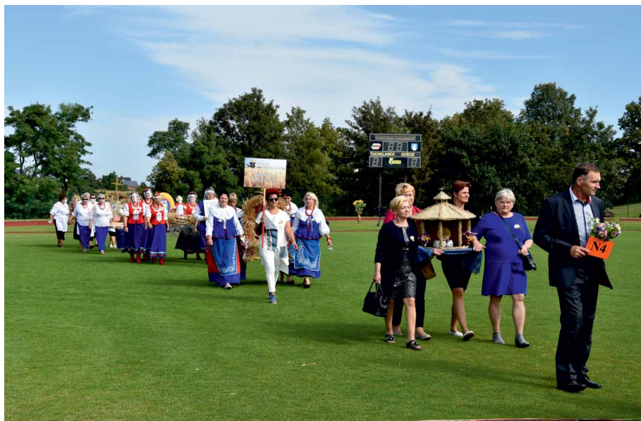
Dożynki Wojewódzkie w Tucholi 2020