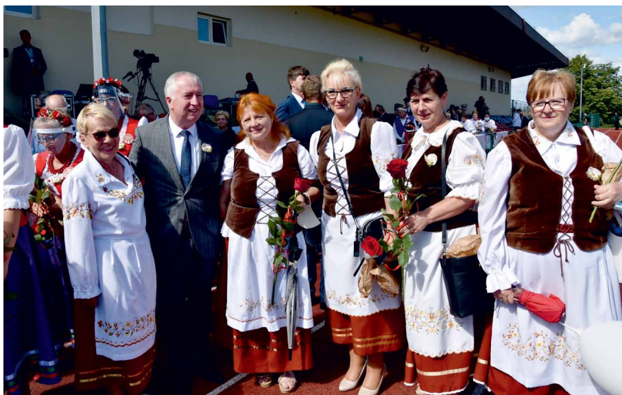
Członkinie Kół w towarzystwie wiceministra rolnictwa i rozwoju wsi – Tuchola 2020