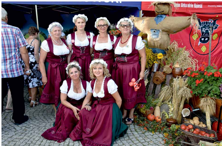
KGW Koneck na Dożynkach Wojewódzkich – Ciechocinek 2019

Kierownik Biura Powiatowego ARiMR dokonuje, w drodze decyzji, wpisu koła gospodyń wiejskich do rejestru po stwierdzeniu, że statut koła jest zgodny z przepisami prawa, założyciele koła spełniają wymagania określone w ustawie o KGW oraz w rejestrze nie dokonano wpisu koła z siedzibą w tej samej wsi. Działające na podstawie ustawy z dnia 8 października 1982 r. o społeczno-zawodowych organizacjach rolników (Dz.U. 1982 nr 32, poz. 217, z późn. zm.) oraz na podstawie ustawy z dnia 7 kwietnia 1989 r. – Prawo o stowarzyszeniach (Dz.U. 2020 poz. 2261) koła gospodyń wiejskich mogą dostosować statuty do wymagań ustalonych w ustawie i wystąpić z wnioskiem o dokonanie wpisu koła gospodyń wiejskich do rejestru zgodnie z przepisami ustawy o KGW. Kierownik Biura Powiatowego ARiMR, po dokonaniu wpisu, wydaje zaświadczenie o wpisaniu koła do rejestru.