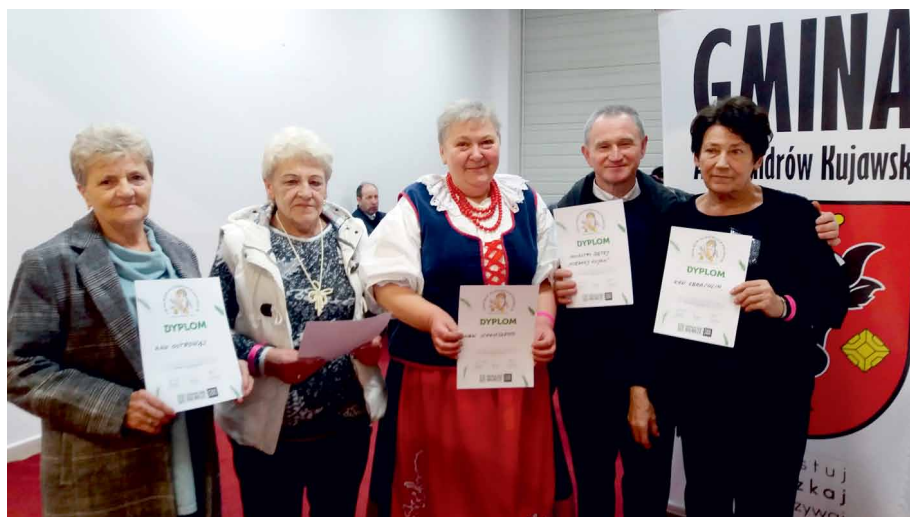
Reprezentanci powiatu aleksandrowskiego na wystawie stołów wigilijnych w Warszawie