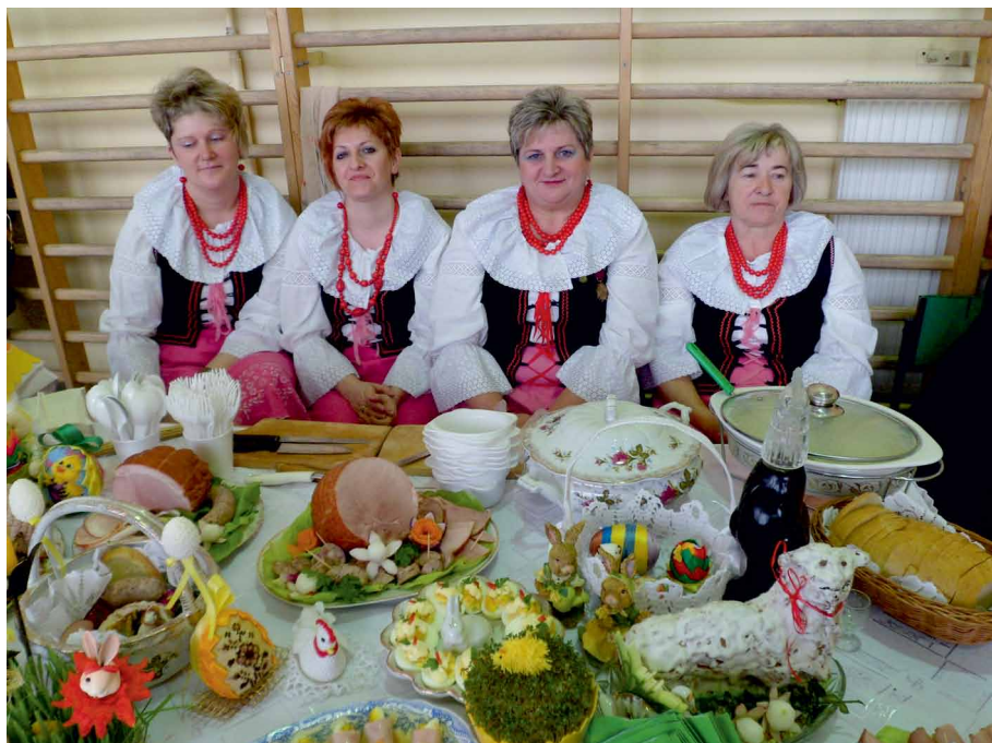
Koło Gospodyń Wiejskich Łowiczek na Powiatowej Prezentacji Stolów Wielkanocnych w Aleksandrowie Kujawskim

Do niedawna KGW działały w oparciu o ustawę z dnia 8 października 1982 r. o społeczno-zawodowych organizacjach rolników, na mocy której były one częścią struktur Kółek Rolniczych i nie posiadały osobowości prawnej, chyba że zarejestrowały się jako stowarzyszenie. Koła takie nie otrzymują bezpośrednio dla siebie pomocy finansowej z budżetu państwa, nie posiadając osobowości prawnej nie mogłyby takiej dotacji rozliczyć. Niemniej jednak pozyskują niewielkie wsparcie ze strony swej rodzimej organizacji – Związków Rolników Kółek i Organizacji Rolniczych oraz od lokalnych samorządów z racji ścisłej z nimi współpracy. Kolejnym mankamentem tej formy działania jest brak możliwości legalnej sprzedaży. Na jarmarkach, targach, imprezach plenerowych mogą to robić jedynie w ramach sprzedaży okazjonalnej, ale wtedy koło powinno wykazać, że jest to sprzedaż prowadzona okazjonalnie, co często, w zależności od interpretacji danego przypadku przez Urząd Skarbowy, może być problematyczne.