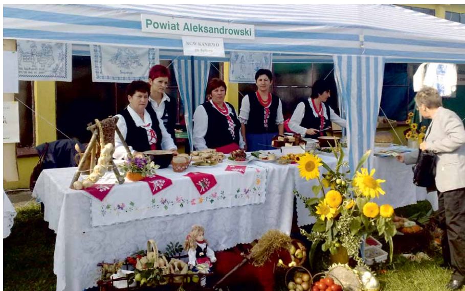
KGW Kaniewo na Festynie Barwy Lata – Dary Jesieni w Przysieku