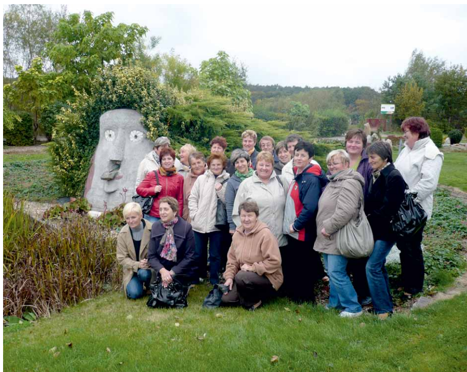
Wycieczka krajoznawcza członkiń KGW z gminy Bądkowo

W przypadku nowo powstających kół, w ich imieniu działa komitet założycielski do czasu rejestracji koła gospodyń wiejskich, a następnie, do czasu wyboru zgodnie ze statutem jego organów. W kołach już istniejących, ale nie zarejestrowanych, funkcjonuje zarząd. Wniosek o wpis koła gospodyń wiejskich do rejestru składa do kierownika właściwego miejscowo Biura Powiatowego Agencji Restrukturyzacji i Modernizacji Rolnictwa komitet założycielski lub zarząd koła. Do wniosku należy dołączyć: