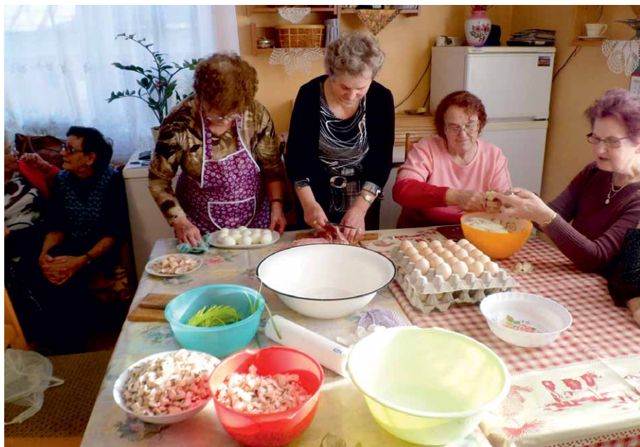
Pokaz kulinarny – Zbrachlin 2012