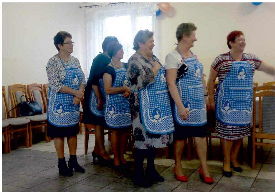
Koło Gospodyń Wiejskich Polne Kwiaty z Kościelnej Wsi podczas wydarzenia Gęsinia na św. Marcina