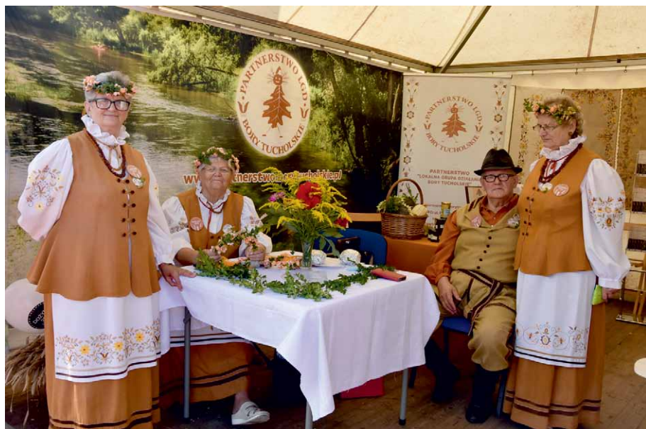
Przedstawicielki KGW z Borów Tucholskich